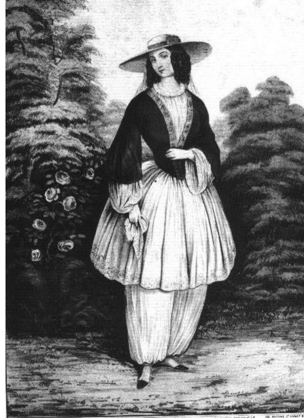
THE BLOOMER COSTUME.