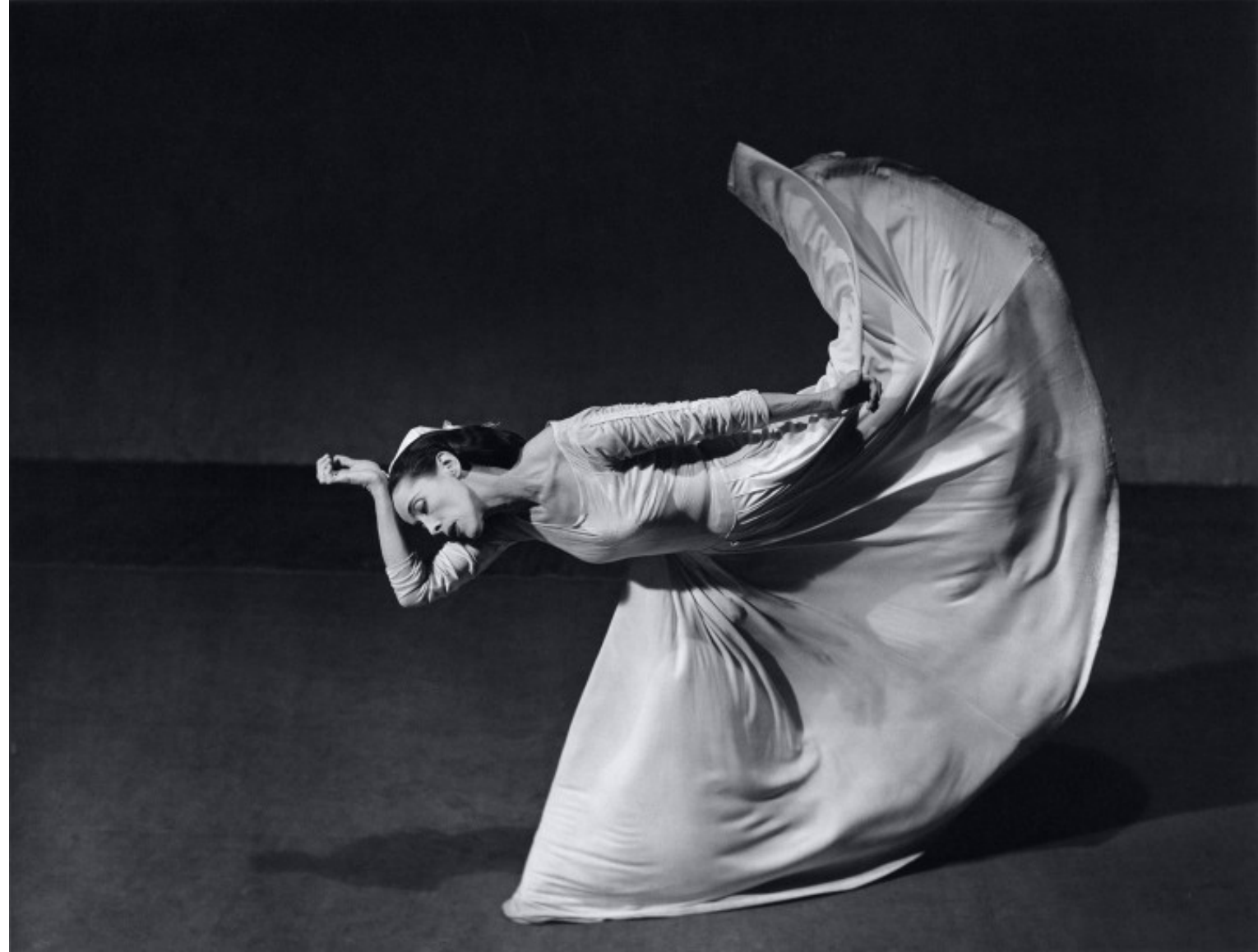
Photographie de Barbara Morgan