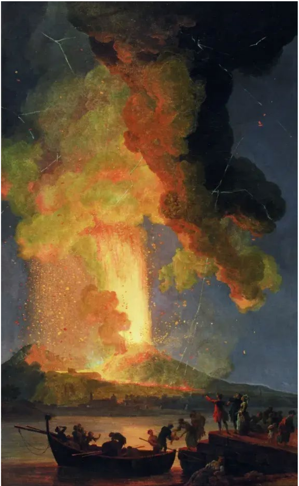
Figure 22 : Pierre-Jacques Volaire. L'éruption du Vésuve , vers 1771, huile sur toile, Musée des Beaux-Arts de Brest.