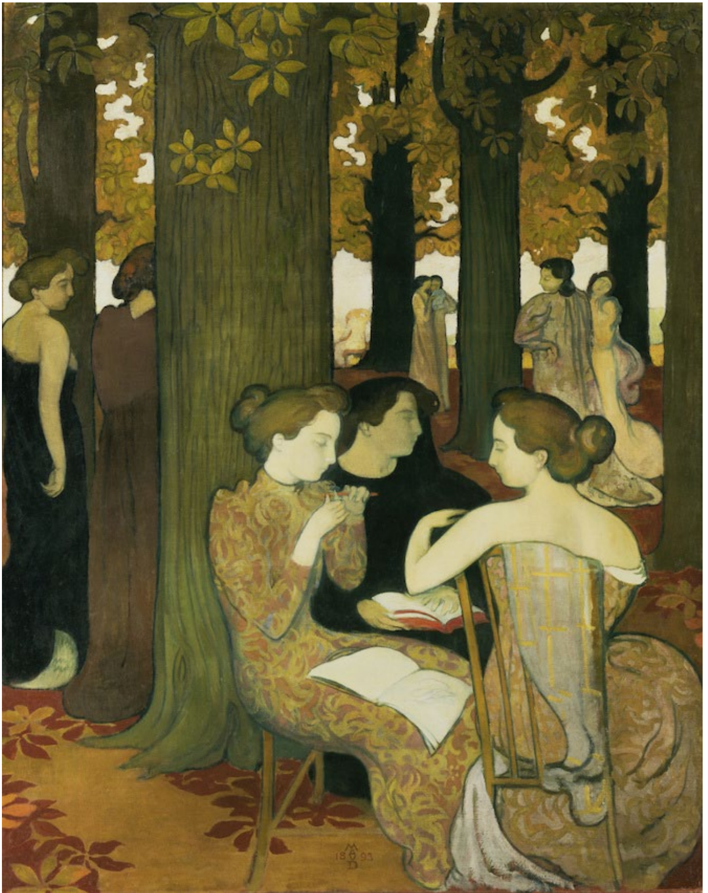
Figure 18 : Maurice Denis. Les Muses , 1893, huile sur toile, Musée d'Orsay.