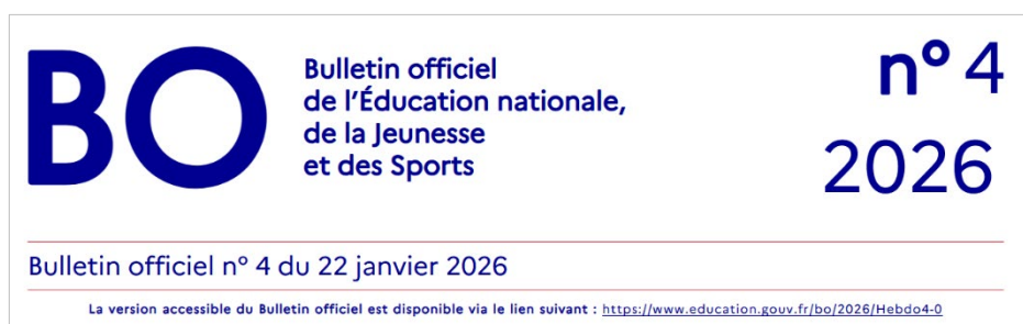
Figure 2 – Encart, Bulletin officiel n°4 du 22 janvier 2026

☞ Programme limitatif pour les enseignements d'option et de spécialité d'arts en cycle terminal (rentrée scolaire 2026) - Objets et enjeux de l'histoire des arts : « Nature ? »