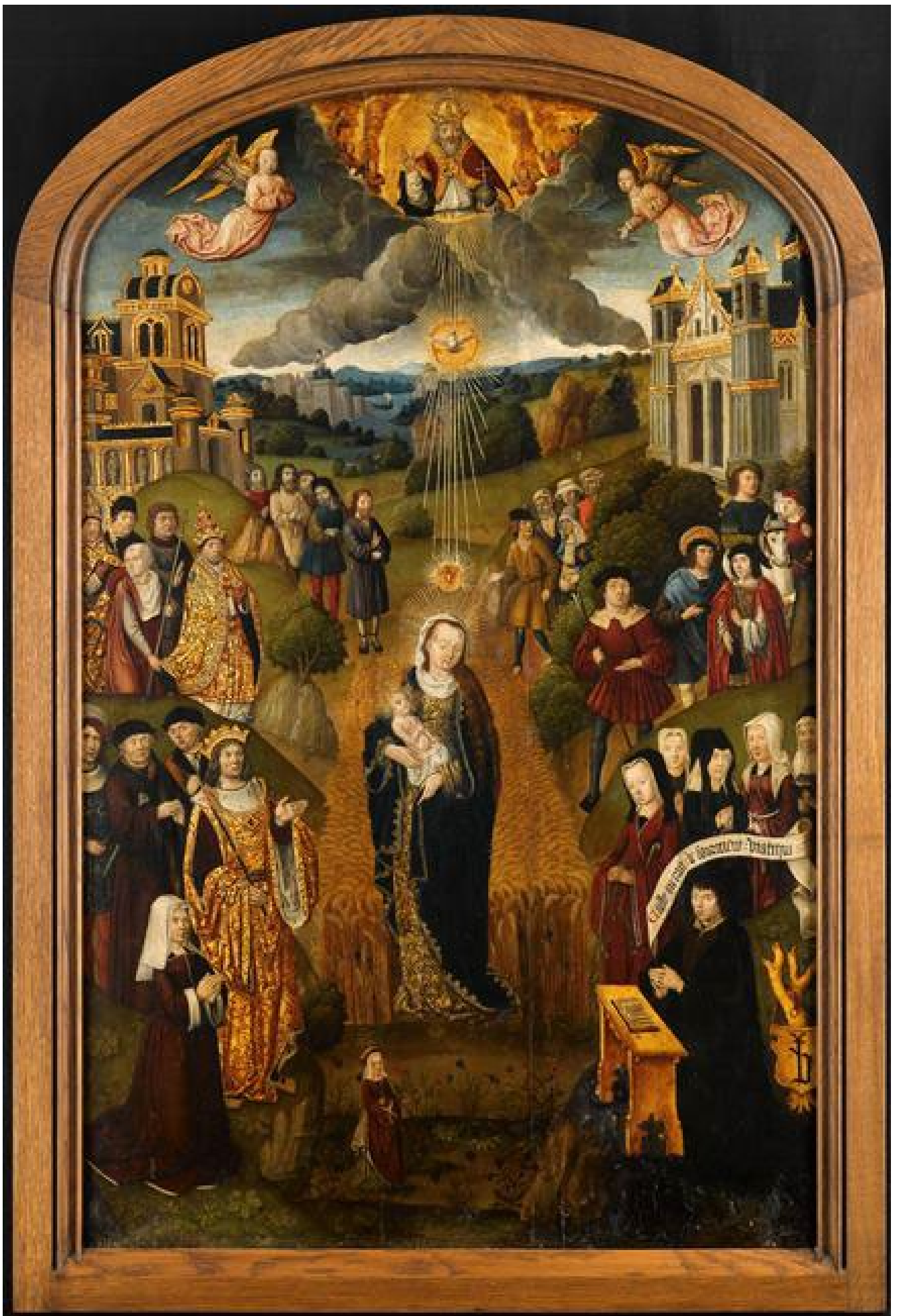
Figure 12 : Anonyme. Puy d'Abbeville, Vierge au froment , début du XVI e siècle, Musée national du Moyen Âge.