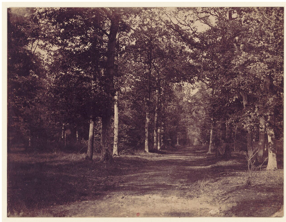
Figure 14 : Gustave Le Gray. Allée dans la forêt de Fontainebleau , 1885, photographie, BnF. Domaine public, Wikimedia

clairières et jeux de lumière composent une nature brute et mystérieuse. Leur démarche s'inscrit en réaction contre l'art officiel dominé par la peinture d'histoire, même si ces artistes restent pleinement intégrés au monde artistique de leur époque. Dans des œuvres comme La Forêt de l'Isle-Adam , Théodore Rousseau cherche moins à décrire fidèlement un site qu'à restituer l'expérience lumineuse et atmosphérique du paysage. Celui-ci aime en effet observer des heures durant, dessiner, parfois peindre d'après nature tel ou tel motif – une feuille, un arbre, un vrai paysage – mais il travaille toujours la composition finale dans son atelier. L'insatisfaction permanente tout comme la peur d'être une fois de plus refusé au Salon expliquent les remaniements constants qu'il fait subir à ses toiles. L'artiste a cherché ici non pas à représenter une allée comme le ferait une photographie, mais à traduire la lumière verticale d'un midi d'été, la lumière la plus difficile à capter pour un peintre, une lumière qui écrase littéralement les objets. Parallèlement, à partir de la fin des années 1840, la photographie de paysage se développe et commence à circuler dans les ateliers d'artistes.