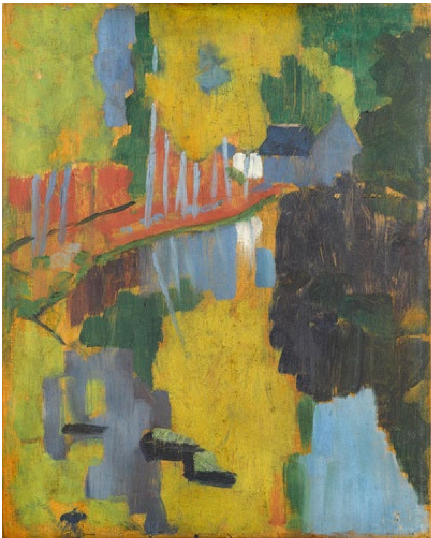
Figure 17 : Paul Sérusier. Le Talisman, Paysage au Bois d'Amour , 1888, huile sur bois, Musée d'Orsay.