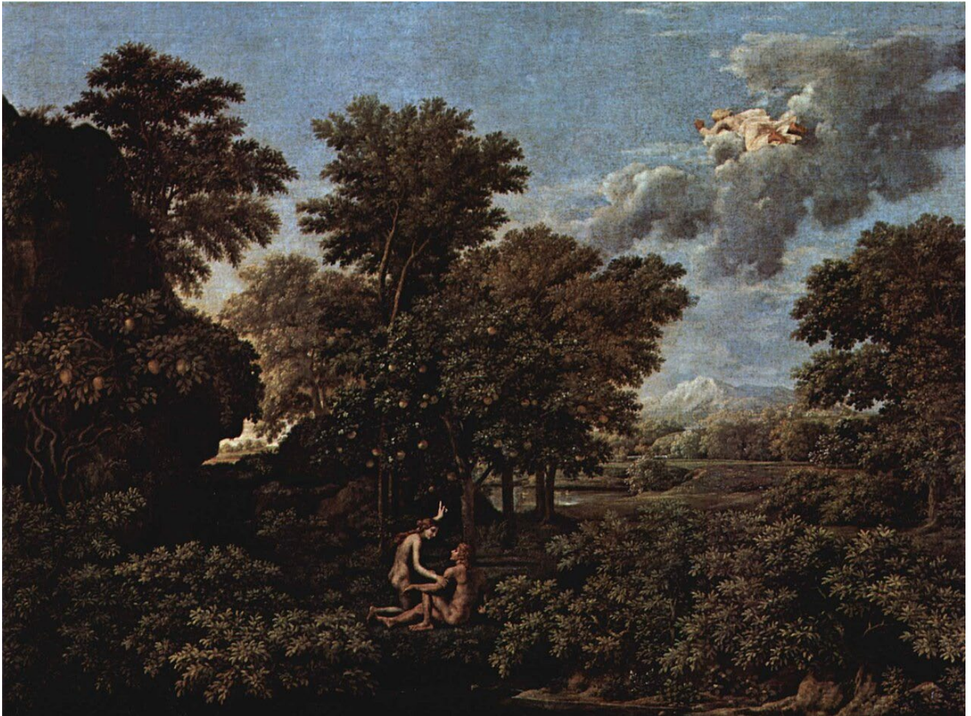
Figure 7 : Nicolas Poussin. Le Printemps ou Le Paradis terrestre, 1660-1664, huile sur toile, Musée du Louvre.

profondeur de l'espace et nuances de verts. Ces quatre tableaux enjoignent de déplacer notre attention au milieu naturel habituellement considéré comme décor 3 .