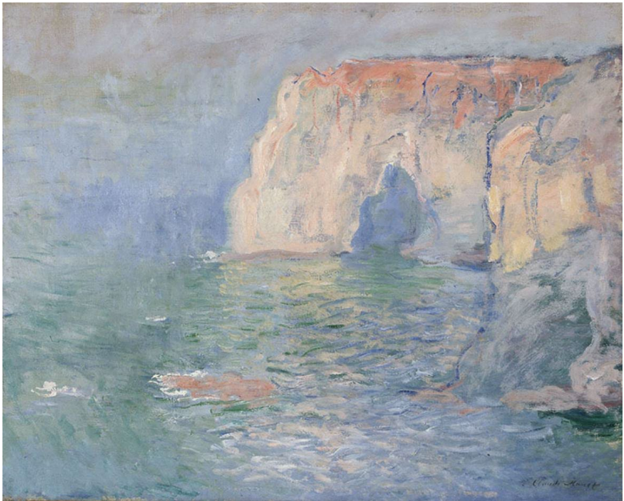
Figure 11 : Claude Monet. Étretat, La Manneporte, reflets sur l'eau , vers 1885, huile sur toile, Musée d'Orsay.

différencient les éléments : lisses pour le ciel, plus épaisses pour la roche, vibrionnantes pour les vagues. L'œuvre a la matérialité d'une esquisse, la couleur appliquée en traits rapides, sans dessin préalable, sans détail de formes, témoigne de sa pratique, à la manière d'un chasseur selon les mots de Guy de Maupassant , créant cinq ou six toiles à la fois, allant de l'une à l'autre, successivement, pour suivre le passage du temps et les variations de la lumière au cours de la journée, capable de traduire d'une simple touche de jaune l'infime rayon de soleil tombant sur la falaise blanche, un éclat bref, un instant passager.