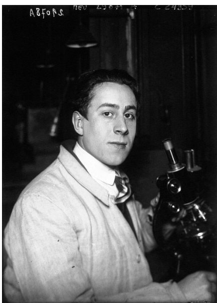
Figure 3 : Agence de presse Meurisse. Portrait de Jean Painlevé à la Sorbonne, 1926, Bibliothèque nationale de France. Domaine public, Wikimedia

Dans l'appel à contribution Être vivant : l'art et les métamorphoses pour La Nuit des Idées (INHA, 2020), le vivant est interrogé, sous des perspectives artistiques, biologiques ou métaphysiques. La notion se définit, du microcosme au macrocosme, par un mouvement constant de transformations : mutations, contaminations, passages et hybridations.