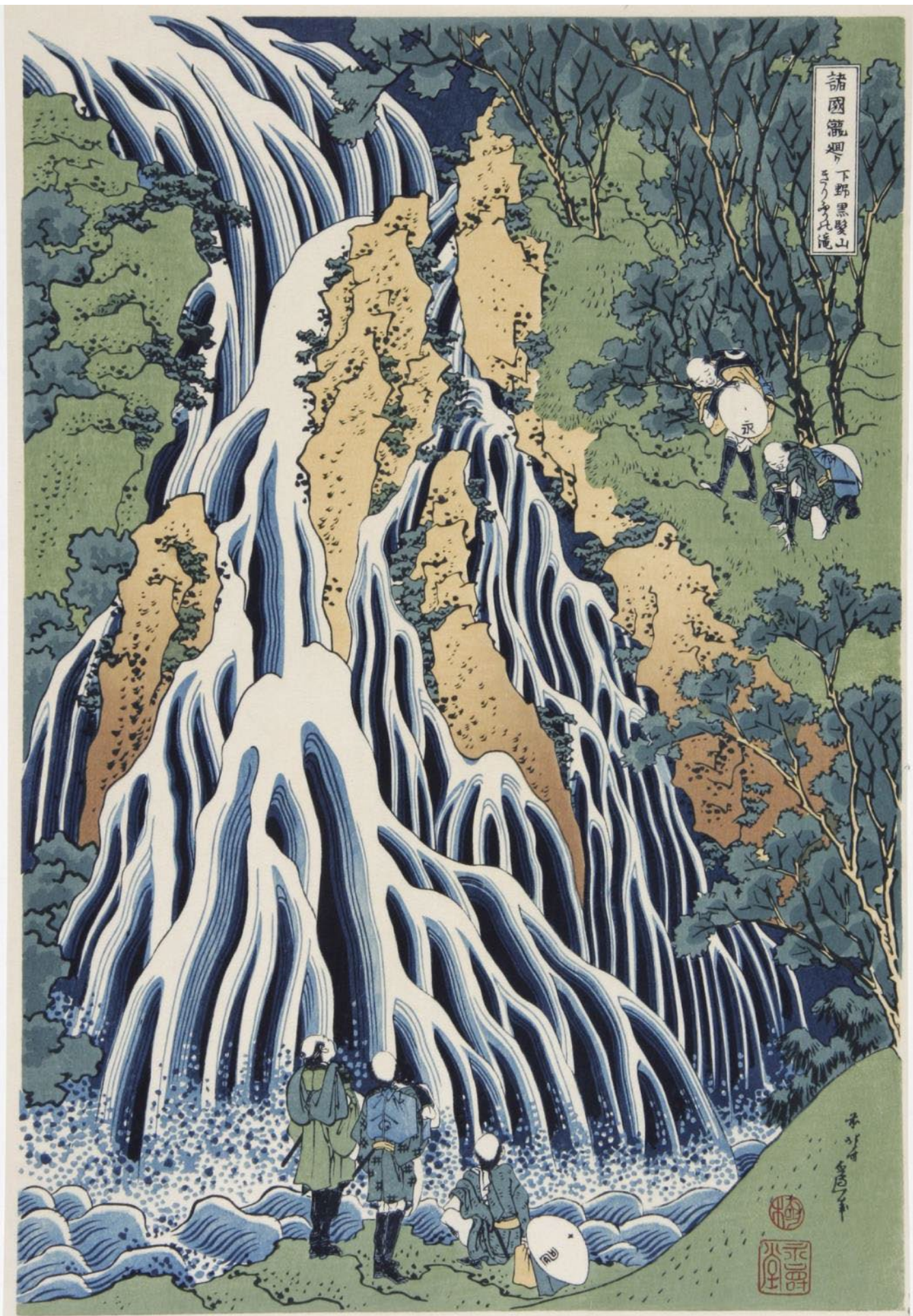
Figure 8 : Katsushika Hokusai. La cascade de Kirifuri sur le mont Kurokami, province de Shimotsuke, 1832-1833, estampe sur bois, Musée des Arts de Philadelphie.