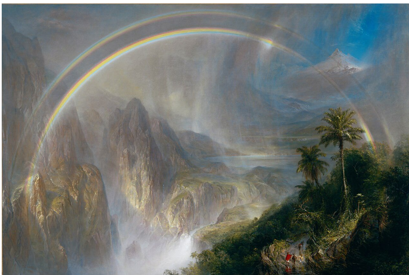
Figure 1 : Frederic Edwin Church. Saison des pluies aux tropiques , 1866, huile sur toile, Musée des Beaux-Arts de San Francisco.