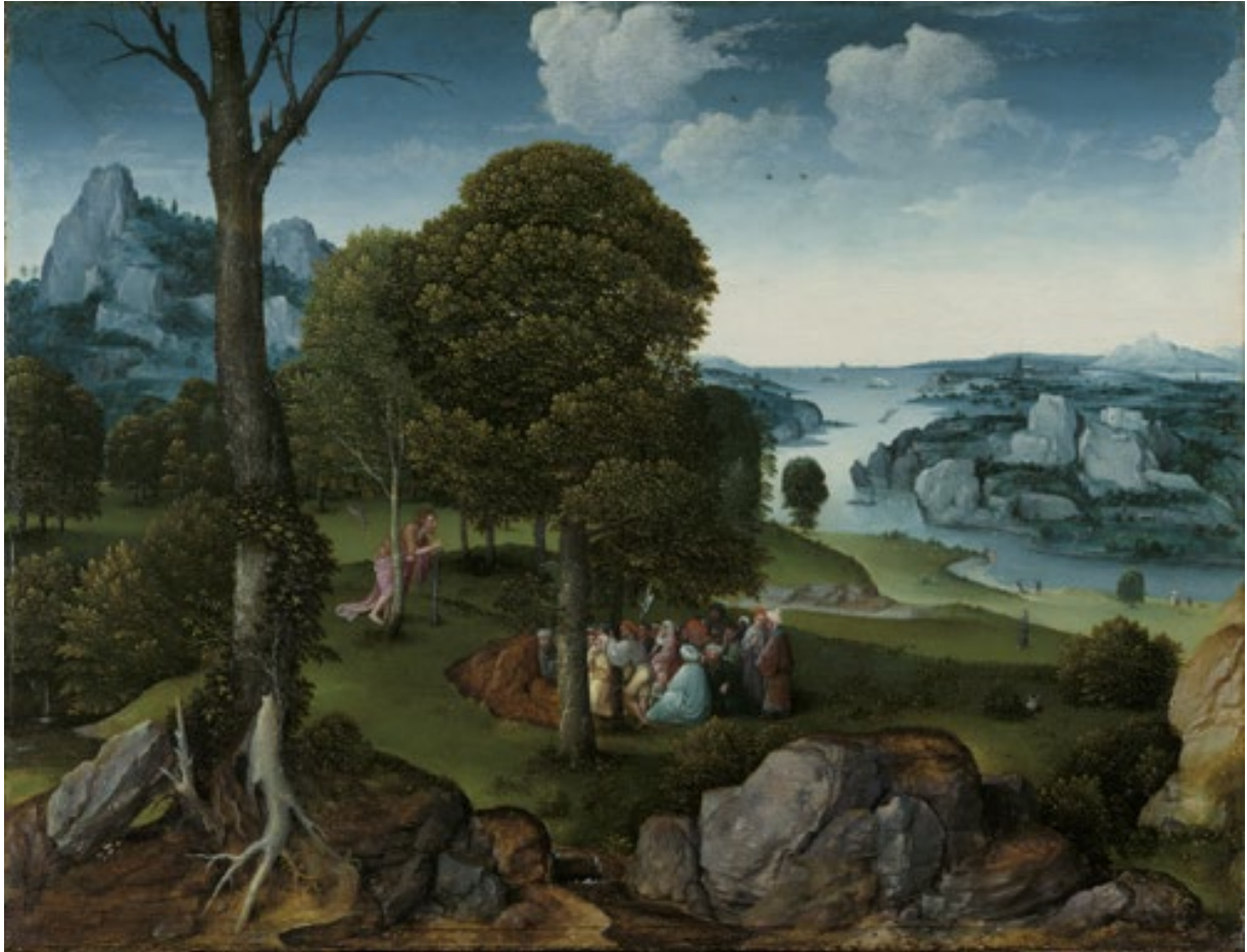
Figure 4 : Joachim Patinir. Paysage avec la prédication de saint Jean-Baptiste , XVI e siècle, huile sur bois, Musées royaux des Beaux-Arts de Belgique.

élèves à la lecture d'extraits d'ouvrages théoriques. La sélection n'est qu'indicative. Les liens invitent à la lecture des comptes-rendus.