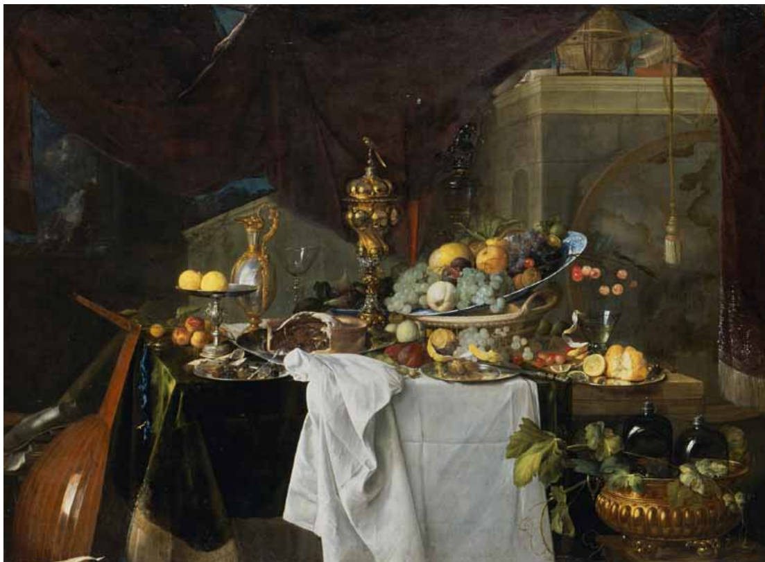
Figure 10 : Jan Davidsz de Heem. Fruits et riche vaisselle sur une table , dit autrefois Un dessert , 1640, Musée du Louvre.

entre peinture et poésie divine du monde. Les natures mortes de Jan Davidsz Heem mettent en scène verres de vins, fruits de saison comme dans Fruits et riche vaisselle sur une table , une opulence décoratrice où la nature est symbolique, les cerises fruits du paradis, les pêches et les pommes fruits défendus alors que le pain et le vin renvoient à l'eucharistie. Les artistes participent à l'élaboration d'une identité nationale et construisent leur spécificité artistique qui les distinguent de l'idéalisme italien.