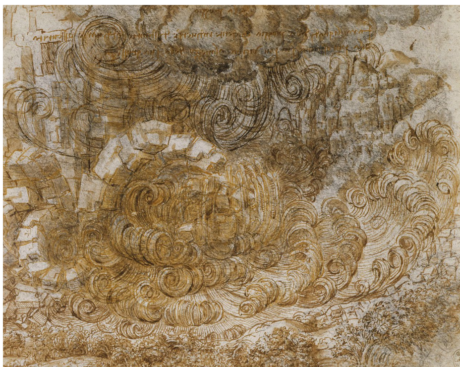
Figure 21 : Léonard de Vinci. Un Déluge, vers 1517-1518, pierre noire, plume et encre, lavis sur papier, Royal Collection Trust, Château de Windsor.

Malgré des cadres conceptuels distincts, de récentes expositions participent au renouvellement du regard sur les relations entre humains, environnements et systèmes terrestres. Cette présentation n'est pas exhaustive et se propose d'offrir des entrées plurielles pour les enseignants. Un premier point de convergence réside dans l'abandon d'une conception strictement représentative de la nature. La nature n'est plus seulement envisagée comme un paysage à contempler ou un motif iconographique. Elle apparaît comme un ensemble de processus dynamiques impliquant des temporalités longues, des interactions multiples et des forces matérielles. Ces expositions contribuent à remettre en cause une perspective anthropocentrique héritée de la modernité occidentale.