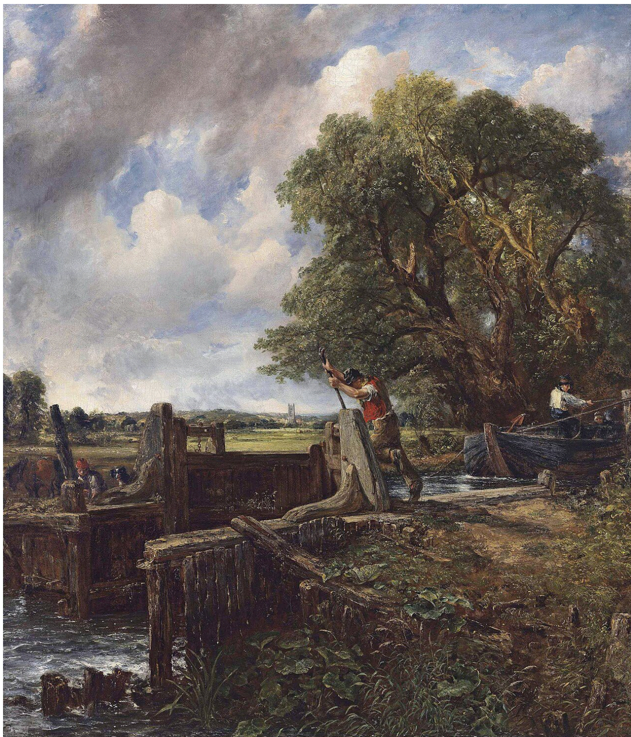
Figure 13 : John Constable. L'Écluse , 1824, huile sur toile, collection privée. Domaine public, Wikimedia

dissolvant les contours et en représentant les nuages comme des formes instables, le peintre remet en question les normes traditionnelles de la représentation, sa pratique ouvre un