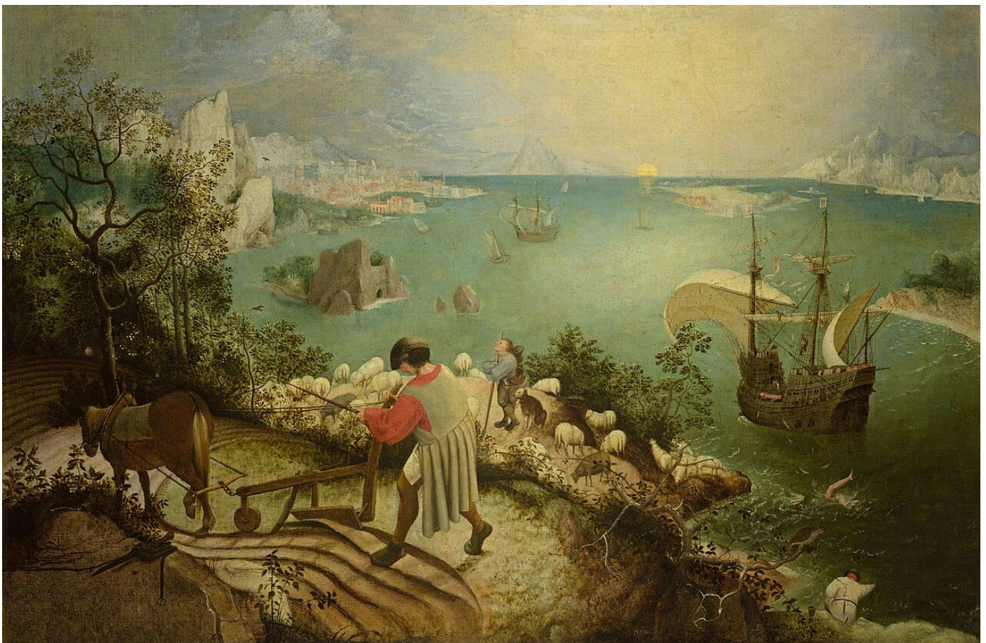
Figure 5 : Pieter Bruegel l'Ancien. La chute d'Icare , vers 1558, huile sur toile, Musées royaux des Beaux-Arts de Belgique.

courbure du fleuve et s'enfonce dans le lointain, découvre des falaises et rochers taillés à vif, un pays vallonné qui se déploie sous les horizons, s'étirant jusqu'au bleu de l'arrière-plan pour créer profondeur et transparence. L'attention est apportée aux arbres vigoureux au centre de la composition. L'artiste invente un paysage allégorique, une peinture dont l'objet est une vue de pays dans son rapport à l'origine. Paysage avec chute d'Icare de Pieter Bruegel l'Ancien est paradigmatique de l'invention du paysage. Quel est l' inventif de la composition ? La nature devient un espace organisé par le regard, le tableau propose un point de vue depuis lequel le monde, considéré à vol d'oiseau, est ordonné, le soleil couché sur l'horizon, l'événement mythologique réduit à un détail marginal.