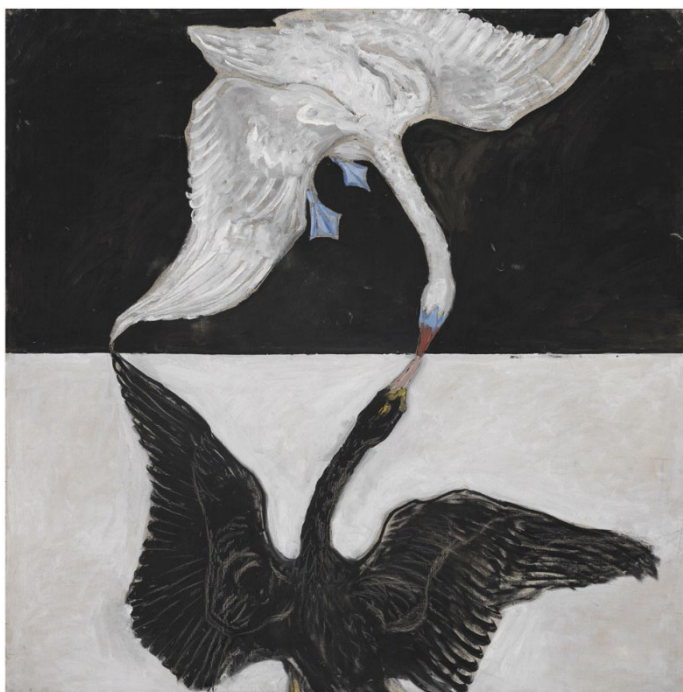
Figure 20 : Hilma af Klint. Le Cygne, n° 1 IX-SUW, 1915, huile sur toile, Moderna Museet.

Entre 1908 et 1921, Wassily Kandinsky met au point un art révolutionnaire, qui renonce à la figure. Dans ce cheminement, le peintre ne se lance pas d'un seul mouvement dans l'abstraction, et sont conservés des années durant, des motifs reconnaissables, présents dans ses paysages de Murnau comme dans ses compositions des années 20. Vassily Kandinsky a maintes fois évoqué son désir d'entrer en « vibration » avec le spectateur. Avec Printemps cosmique František Kupka développe une abstraction organique et géométrique pour transcrire le commencement de la vie et les métamorphoses de la matière. Dans la composition du tableau, le motif de tournoiement suggère la gravitation planétaire, les formes végétales et biologiques évoquées par l'explosion de lumière et de couleur traduisent, elles, la floraison, la germination et les processus de croissance annoncés par la venue du printemps.