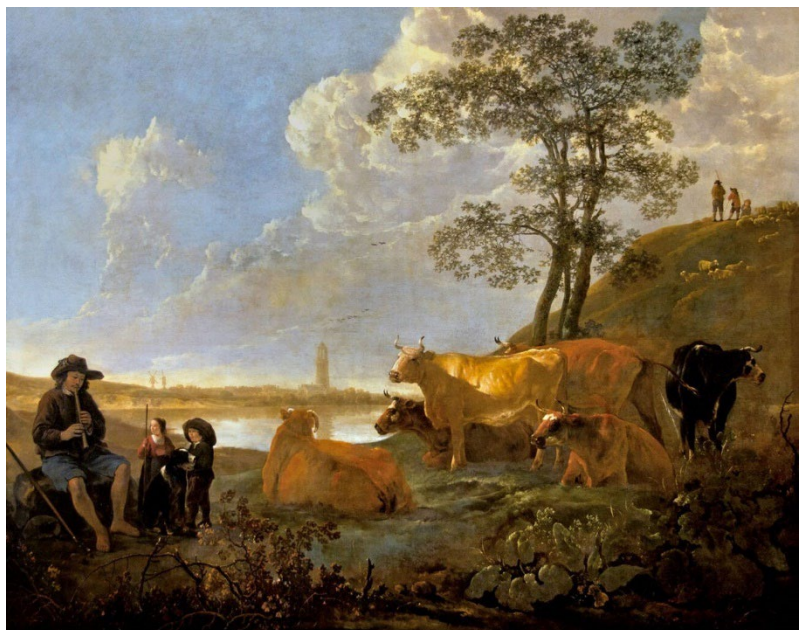
Figure 9 : Aelbrecht Cuyp. Paysage près de Rhenen : vaches au pâturage et berger jouant de la flûte, 1650–55, huile sur toile, Musée du Louvre.

Son imagination visionnaire traduit un sentiment de paix, un accord définitif entre l'homme et la nature. C'est une vision idyllique qui est proposée ici, une pastorale où règne une atmosphère de sérénité.