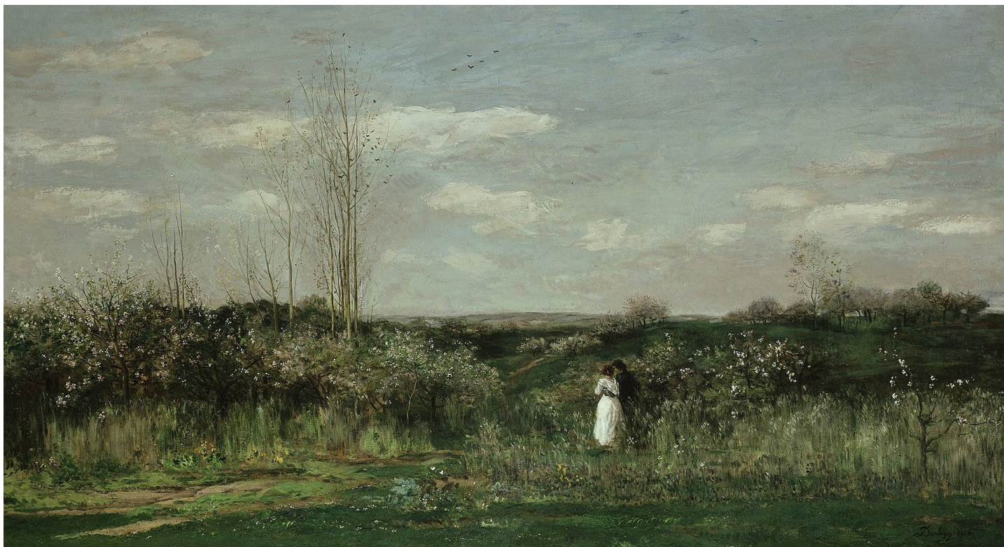
Figure 15 : Charles-François Daubigny. Le Printemps, 1862, huile sur toile, Ancienne Galerie nationale.

L'exposition met également en lumière les « motifs » de prédilection des impressionnistes, Claude Monet , Alfred Sisley , Camille Pissarro ou encore Pierre-Auguste Renoir dans les années 1870 : les bords de Seine et leur activité fluviale, les campagnes d'Île-de-France, les jardins et les lieux de villégiature. Le paysage qui s'y déploie n'est pas celui d'une nature vierge ou édénique, mais d'un environnement profondément transformé par l'homme, une nature « anthropisée » pleinement inscrite dans la modernité. À partir des années 1880, les impressionnistes, et plus particulièrement Claude Monet , se tournent progressivement vers des paysages plus « purs », explorant des effets atmosphériques et lumineux toujours plus complexes. Le paysage devient alors un espace d'immersion, où l'homme et le peintre se trouvent comme plongés, à l'échelle de la nature. Les emprunts à l'art japonais des jardins sont manifestes à travers l'aménagement de l'étang de Giverny ; la passerelle, la vaste étendue d'eau fleurie rappellent les ponts si présents dans les estampes japonaises. Le peintre partage la vision des grands maîtres de l' ukiyo-e , sa façon de simplifier les formes, de multiplier les points de vue, une manière de traduire le monde en privilégiant la sensibilité.