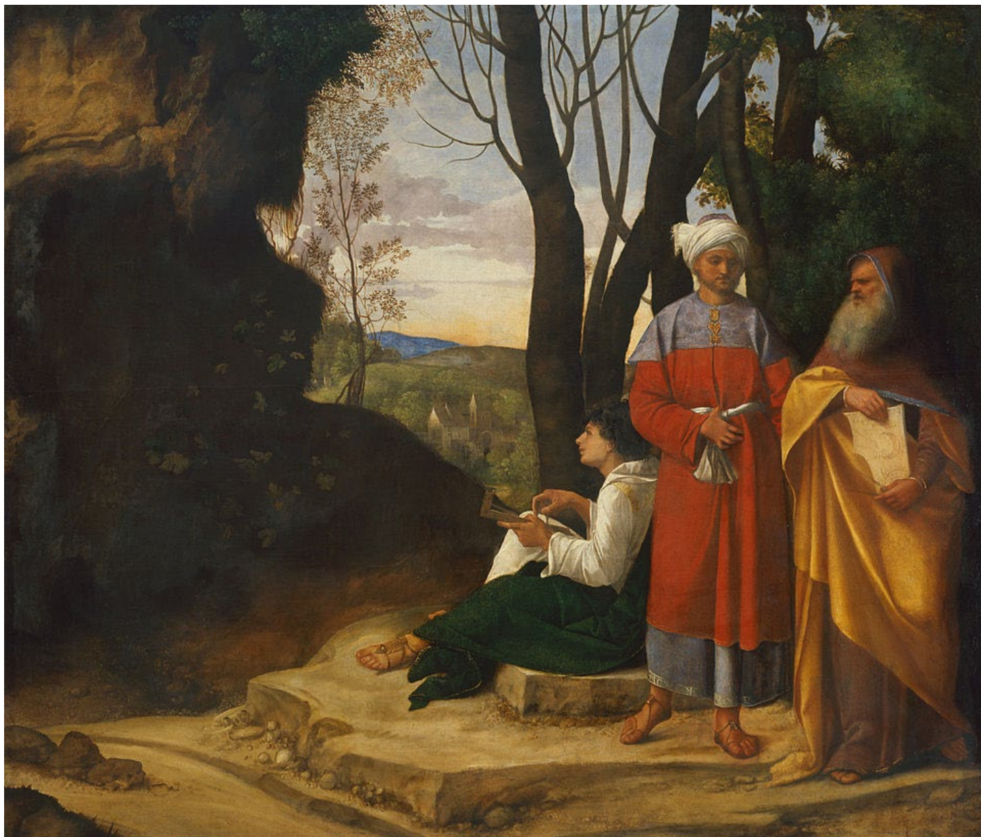
Figure 6 : Giorgione. Les trois philosophes , vers 1509, huile sur toile, Musée d'Histoire de l'art de Vienne. Domaine public, Wikimedia

Trois philosophes , la douceur lyrique du paysage, la matière picturale du minéral l'emporte sur l'anecdote et la narration. Giorgione intègre l'apport de la peinture du Nord et des Flamands : la nature est vue comme miroir de la création, elle traduit un sentiment profond d'unité et d'harmonie, fondement de la beauté recherchée par le peintre, selon une vision néoplatonicienne et musicale des rapports secrets de l'univers.